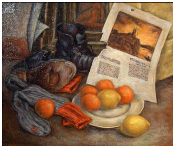
2.attēls. Frederiks Hāgens. Klusā daba uz grīdas . 2001. Audekls, eļļa, 29,5 x 35 cm