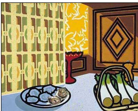
1.attēls. Patriks Kolfilds. Rudens . 1958. Audekls, eļļa, 40 x 31,6 cm