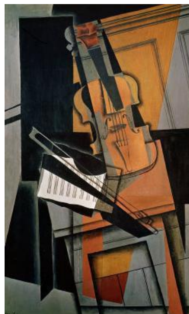
4.attēls. Huans Griss. Vijole . 1916. Audekls, eļļa, 23 x 30 cm. Privātkolekcija