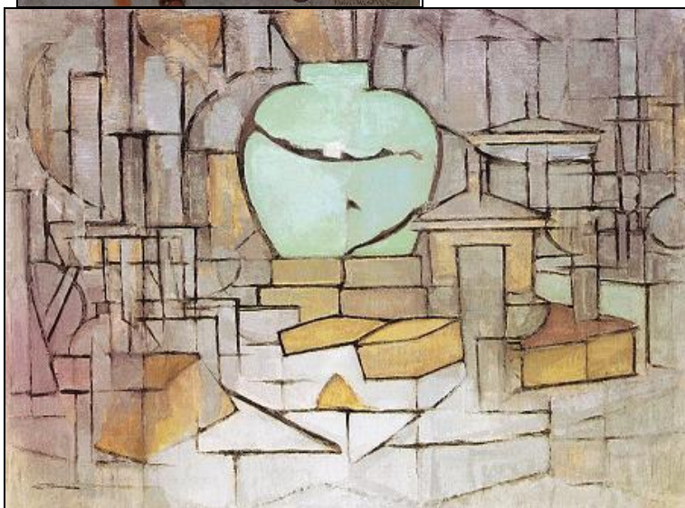
4.attēls. Pīts Mondrians. Kusā daba ar ingvera trauku. 1932. Audekls, eļļa.