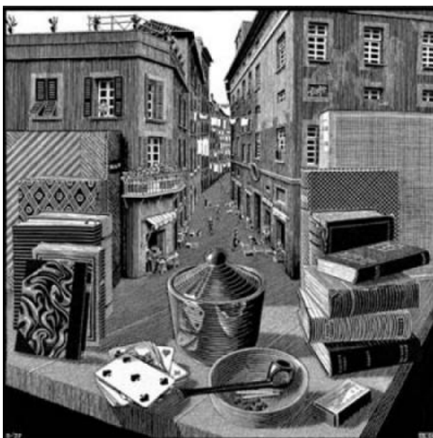
3.attēls. M.C.Ešers. Klusā daba un iela . 1956. Litogrāfija, 55 x 65 cm. Privātkolekcija