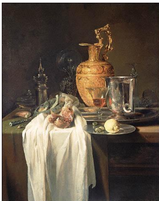
1.attēls. Villems Kalfs. Klusā daba ar granātābolu . Ap 1650. Audekls, eļļa, 202,4 x 297,8 cm Minhene