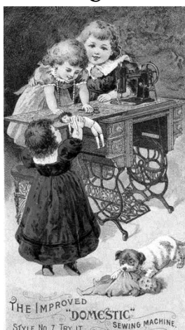
Šujmašīnu reklāma, 19.gs. beigās