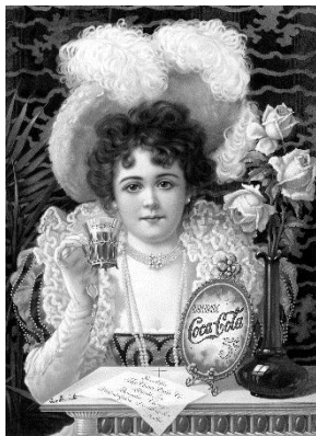
Coca-Cola reklāma, 1890.gads