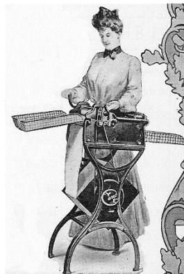
Kopējamo mašīnu reklāma, 1897.gads