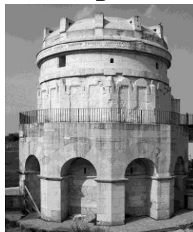
Ostgotu valdnieka Teodoriha Lielā mauzolejs, celts ap 520.g.