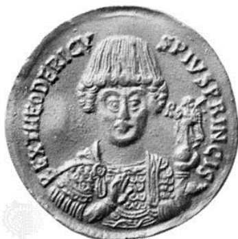
Ostgotu valdnieka Teodoriha Lielā (451-526) monēta ar uzrakstu latīņu valodā «Karalis Teodorihs – dievbijīgais valdnieks»