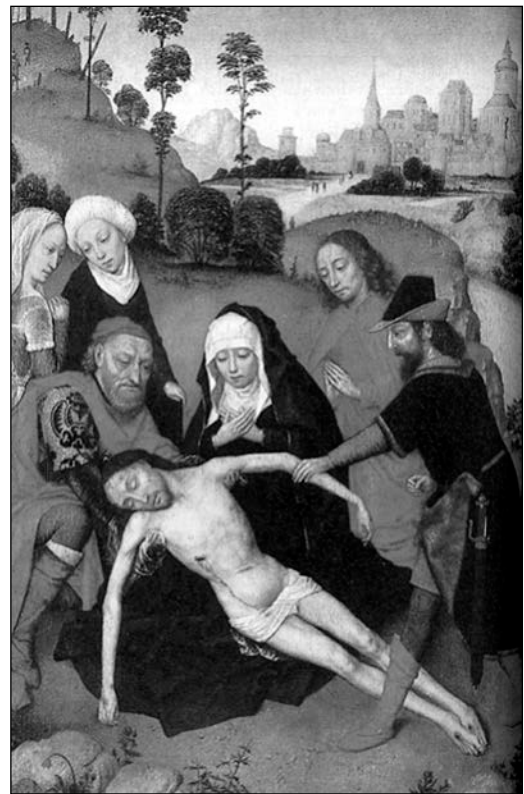
Kristus glābšana. Viduslaiku glezna