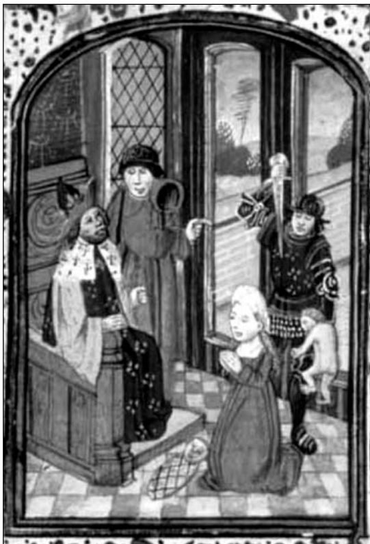
Jūdu valdnieks Hērods liek apkaut bērņus Bētleme. Viduslaiku glezna